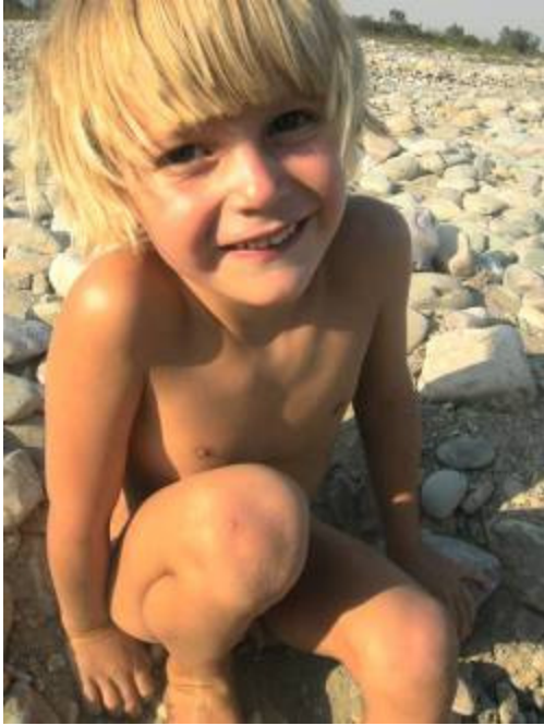
A la rivière