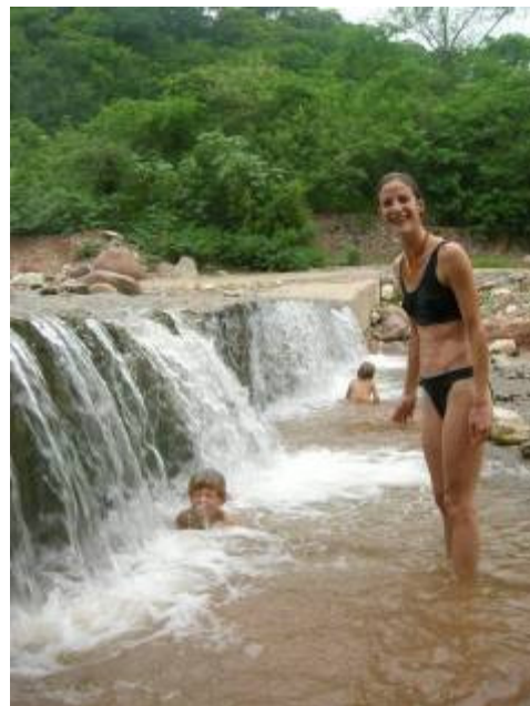
Baignade dans le parc national de Calilegua, Argentine

également de délicieuses baignades dans de jolis ruisseaux dévalant des montagnes.