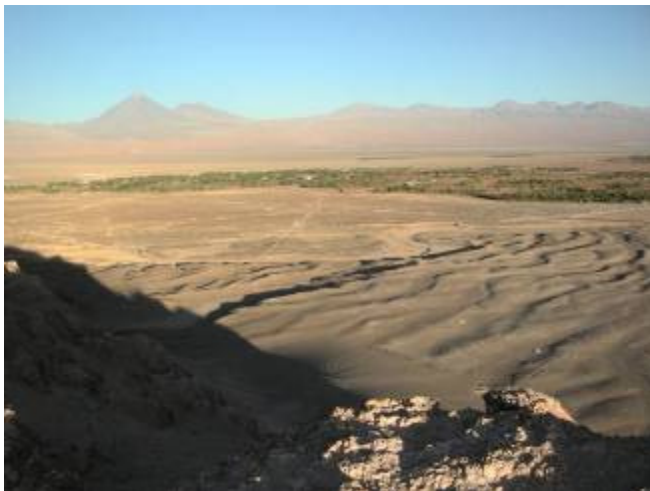
L'oasis de San Pedro au milieu du désert d'Atacama, au Chili

Le soir, on arrive à San Pedro de Atacama, joli petit village aux maisons et aux rues de terre crue, située au cœur d'un réseau d'oasis en bordure d'un grand salar entouré de volcan. Une oasis de verdure et de douceur au milieu d'un paysage véritablement lunaire.