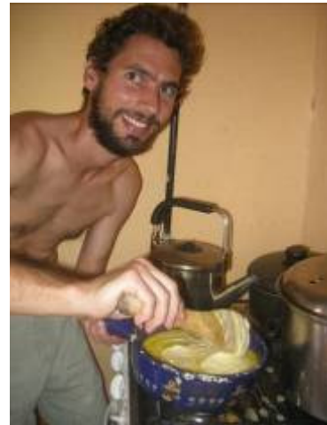
Fondueman en pleine action