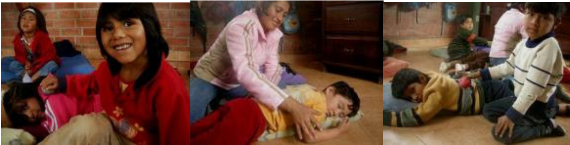
Les massages pour recommencer l'après-midi

Creciendo est une école qui accueille des élèves issus de familles socialement et économiquement défavorisées et qui sont très souvent refusés par les autres écoles. Afin de lutter contre ces désavantages et de s'attaquer au problème dès le début de la scolarité, l'école Creciendo avait le désir d'améliorer son jardin d'enfants. C'est pour cela que j'ai atterri ici pour la seconde fois, avec cependant un rôle différent que lors de mon premier séjour. Je ne suis plus « jardinière d'enfants », mais « conseillère pédagogique ». J'appuie les enseignantes dans leur travail. Ensemble, nous avons atteint quelques résultats au cours de cette année.