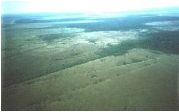
Chaussées surélevées en terre d'origine préhispanique traversant la savane amazonienne du Béni, Bolivie.

Contrairement à ce que l'on a longtemps pensé, il semble que les indiens d'Amérique, qu'ils aient vécu en sociétés complexes ou en petits groupes, ont eu une influence forte et réfléchi sur leur environnement naturel. Ainsi, en Amérique du Nord, il semble probable que les grandes plaines soient en grande partie une œuvre humaine. En effet, les indiens mettaient régulièrement le feu aux plaines, de façon à entretenir des immenses prairies semi-artificielles, qui permettaient aux grands troupeaux, par exemple les bisons, de se multiplier et de constituer un immense garde-manger à proximité. Les magnifiques plaines nord-américaines « naturelles » qui résultèrent tant utiles aux cow-boys étaient ainsi en partie du moins une œuvre des indiens. Le feu a également servi pour développer l'agriculture, comme par exemple dans le Béni.