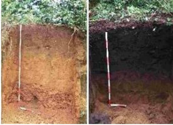
A gauche, terre amazonienne naturelle, à droite la terre noire, enrichie.

A l'arrivée de Colomb, l'Amérique était une véritable ruche, probablement aussi peuplée que l'Europe à la même époque. Le « nouveau » continent était habité par des centaines de cultures très diverses, ayant atteint des stades de développement très avancés, bien que très différents les uns des