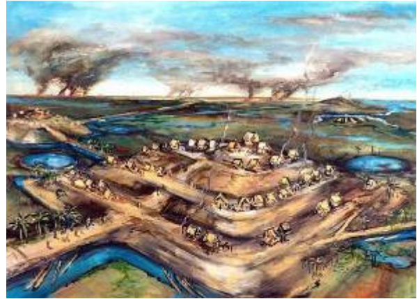
Vue d'artiste de villages dans les plaines amazoniennes de la Bolivie, il y a 2000 ans. Peinture de Dan Brinkmeier

peu densément peuplée, des études récentes semblent montrer le contraire.