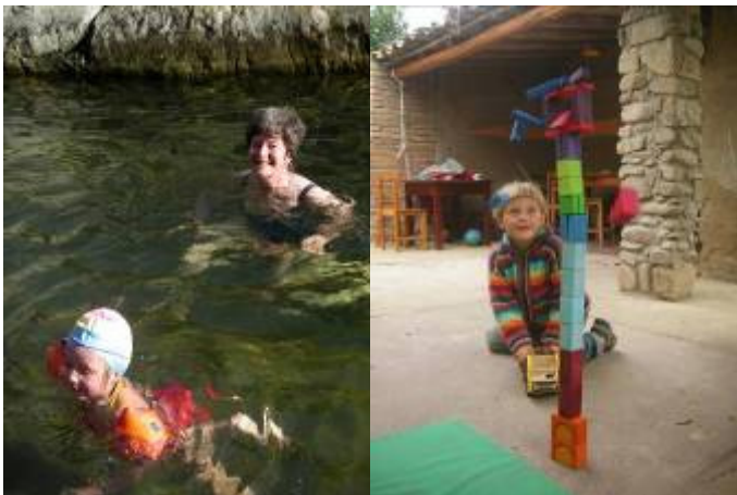
A la rivière