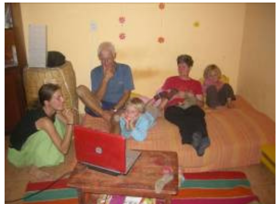
Moment DVD en famille