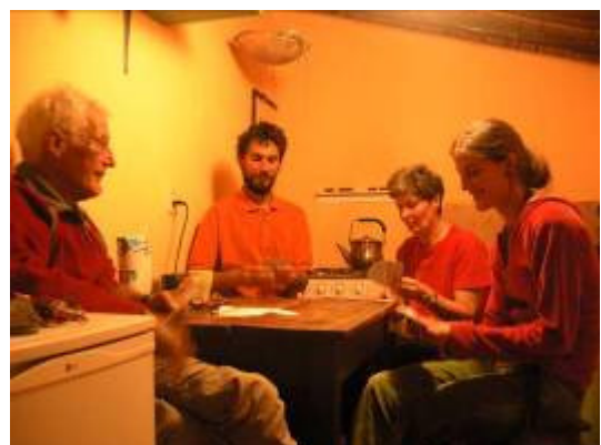
Soirée chibre, version suisse allemande