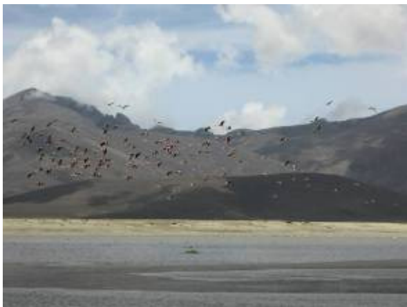
Vol de flamands roses sur les lagunes de Tajzara, altiplano de Tarija

première pause et le premier pique-nique du voyage ont eut lieu au bord des lagunes de Tajzara. Un lieu magique à 3500 mètres d'altitude qui comporte des dunes de sable, des lamas broutant on ne sait trop quoi, et des lagunes peuplées d'étonnants flamands roses.