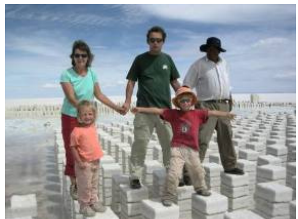
On fait les zouaves sur des briques de sel