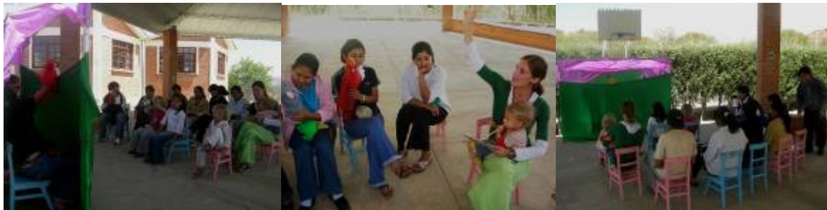
Cour de marionnettes avec les étudiants de l'Ecole Normale

l'amitié et le véritable travail en commun est important et enrichissant pour une équipe d'enseignants.