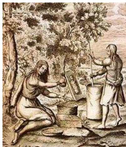
Iroquoises au travail, pilant du grain ou des fruits secs (gravure de 1664)

En lisant attentivement les récits des premiers explorateurs et colons, on s'aperçoit que ces derniers étaient très impressionnés par la qualité de vie dont jouissait les indiens, et surtout par ceux qui vivaient en petit groupe dans des conditions de vie a priori rudimentaires. Ainsi, les indiens étaient en général plus grands, plus forts, plus propres et mieux nourris que les européens. De nombreux voyageurs furent fascinés par leur amour de la liberté et leurs organisations politiques généralement beaucoup plus démocratiques que celles qu'ils avaient laissées derrière eux. La Haudenosaunee , plus connue sous le nom de « Confédération Iroquoise » et qui date probablement du XIII e siècle, a probablement été le deuxième parlement le plus ancien au monde, après l'Althing d'Islande.