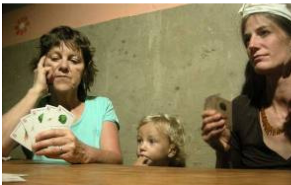
Luca préfère-t-il la version romande du chibre ?