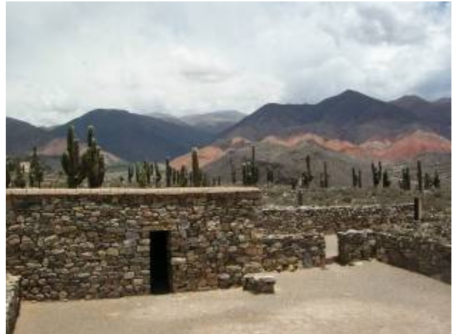
Vallée de Humahuaca, Argentine

montagnes multicolores. On y trouve un magnifique petit hôtel, qui nous retiendra deux jours dans cette belle région de la Vallée de Humahuaca, récemment promue par l'UNESCO au rang de patrimoine mondial de l'Humanité. Le tourisme semble s'y développer très rapidement, avec son lot de conséquences, certaines positives et d'autres moins.