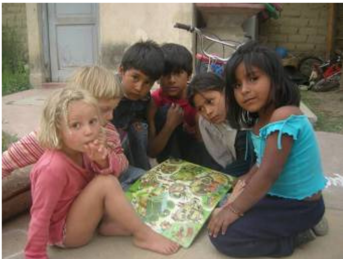
Avec les copains du quartier