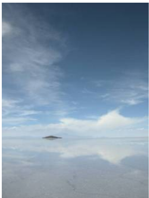
Le salar d'Uyuni après la pluie

Après un pique-nique gargantuesque sur l'île, on continue le voyage sur cet incroyable océan blanc. Les premières pluies de la saison ont laissé une petite couche d'eau à certains endroits, dans laquelle se reflète le ciel, donnant l'impression que l'on vole !