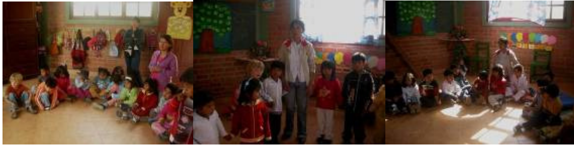
Le rituel du matin

Pour le travail en atelier, le concept n'était pas encore tout-à-fait clair pour toutes en début d'année. Il faut noter qu'à Creciendo la direction demande à chaque enseignante de mettre en place au moins un atelier durant l'année. Comme promis, je les ai donc aidées toute au long de l'année dans la planification, la préparation du matériel, ainsi que lors du début de l'atelier. Lors du bilan de fin d'année, beaucoup de collègues ont fait ressortir le fait que le travail en atelier représente un gros investissement et que ce n'est pas facile au début. Mais elles ont également remarqué qu'elles y ont pris beaucoup de plaisir, et que les élèves ont travaillé avec beaucoup de zèle.