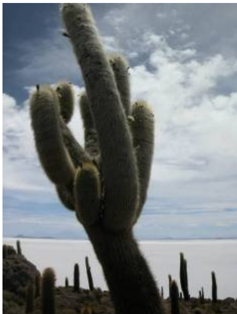
Cactus géant sur une île au milieu du Salar

d'une très ancienne éruption sous marine, ce qui se traduit par des laves « en coussins », soit de grosses boules noires de basalte, prises dans une gangue de corail clair. Difficile d'imaginer que cette « île », qui se trouve maintenant à 3600 mètres d'altitude, ait pu naître dans une mer assez chaude pour avoir abrité des récifs coralliens !