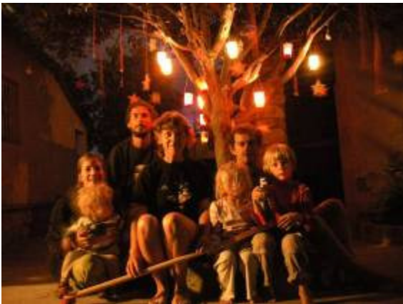
Pour cause de pluie, on a dû attendre Nouvel An pour allumer le mandarinier de Noël